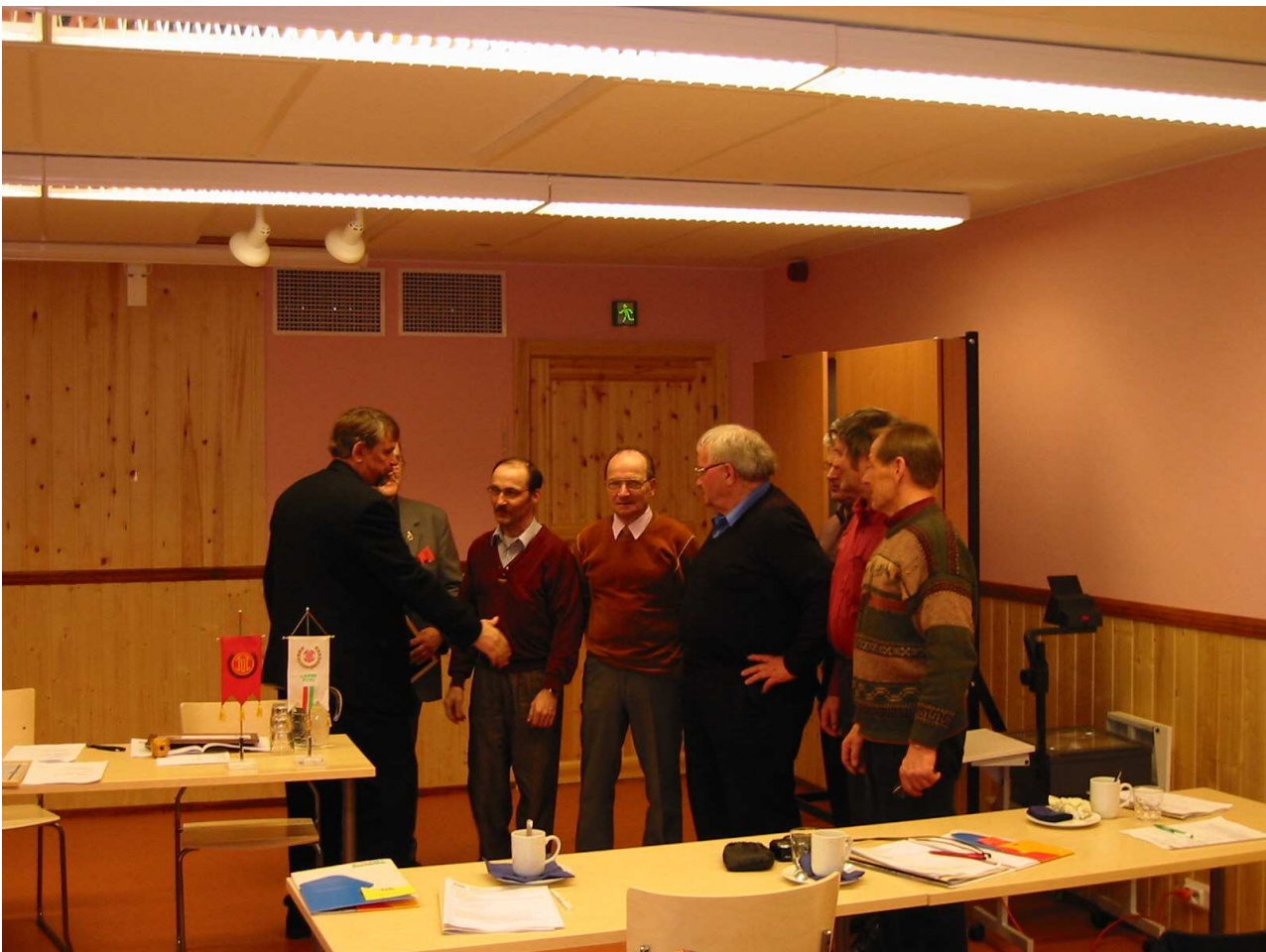
kuva: Rovaniemen Lapin, palkitun seuran johtoa

Huomioinnit suoritetaan joko piirikokouksessa tai seuran ilmoittamassa juhlavassa tilaisuudessa. Huomiointi muotoja ovat raha (urheilijastipendi), ansiomerkki, piirin standartti tai piirin kunniataulu.